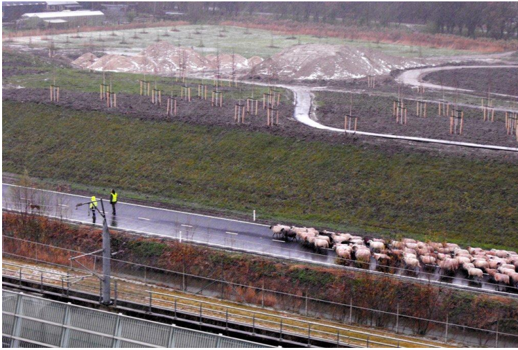
CONSUMENTEN ZIJN GEEN MAKKE SCHAPEN (SCHAPEN OP DE ZORO-LIJN, 2 DECEMBER 2012) 25